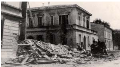
La distruzione dei bombardamenti