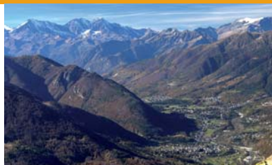
Panorama della Val Vigizzo, detta anche "Valle dei Pittori", vista dal Torriggia.