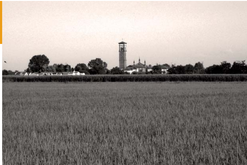
Panorama sulla Chiesa di Villanova del Sillaro