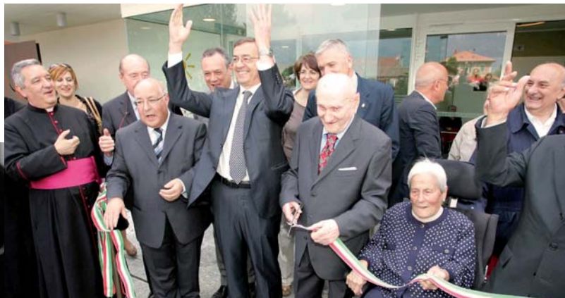
Il taglio del nastro durante la festosa giornata di inaugurazione della Residenza Medale